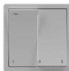
Bedienteil Doppelwippe (inVENTer-Design oder eigenes Schalterprogramm)