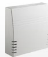
Optionale Sensorik: z. B. CO 2 -Sensor CS1

Bis zu 4 angeschlossene Systeme steuert der Regler sMove. Die Lüftungsintensität wird intuitiv mit Touch&Slide eingestellt – in den Betriebsarten Wärmerückgewinnung oder Durchlüftung. Eine Pausenfunktion ist ebenfalls verfügbar.